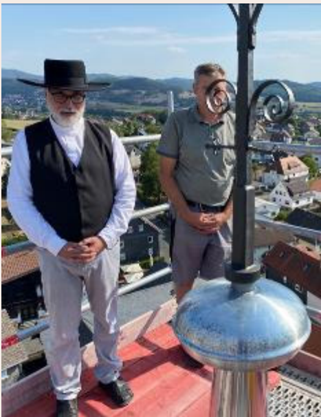
Gebet bei der Aufrichtung des Hahns

Seit fast 200 Jahren verfassen Dautpher Pfarrer Momentaufnahmen der kirchlichen Situation. Eine solche Skizze versuchen die folgenden Zeilen für das Jahr 2022. Wir leben in einer Zeit des Abbruchs, des Umbruchs – und des Neuaufbruchs.