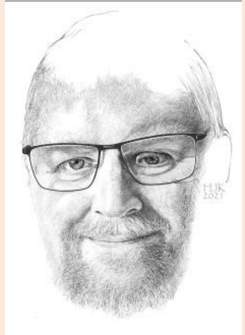
Rüdiger Jung Zeichnung von Hans-Jürgen Kind 2021