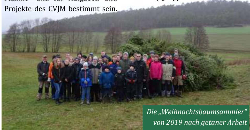
Die „Weihnachtsbaumsammler“ von 2019 nach getaner Arbeit

Es grüßt Sie der CVJM Dautphe und die Konfigruppe unserer Gemeinde